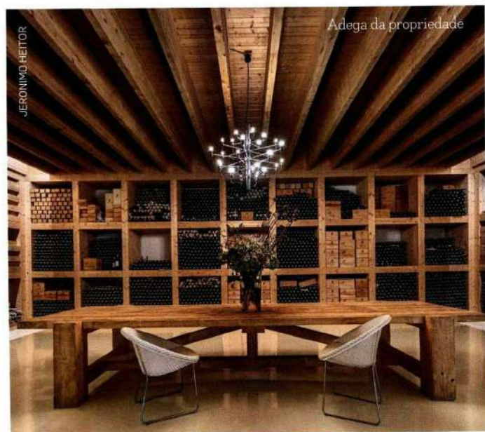
Adega da propriedade